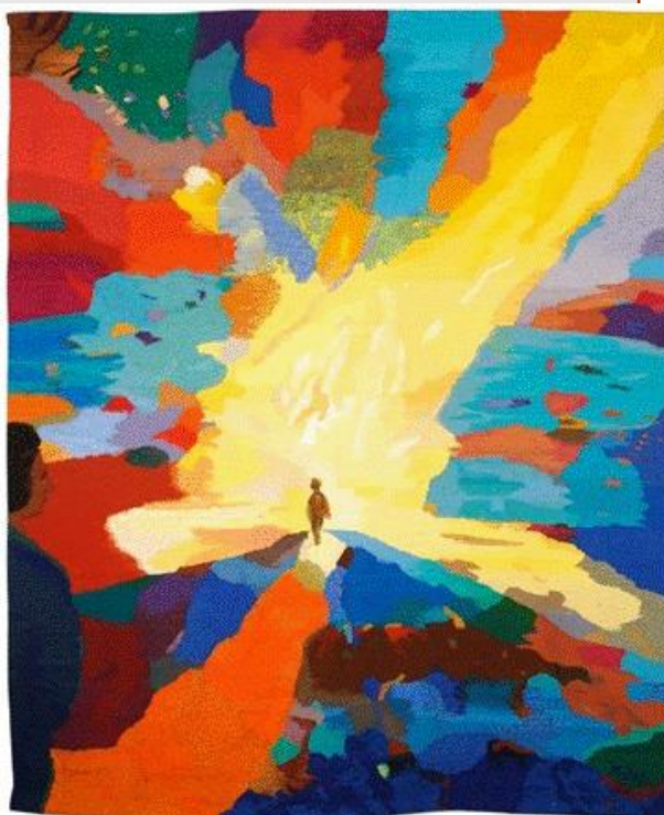
"L'enfant et la vie" Malel

Merci car grâce à vous je suis bénévole à Bagage'rue sur Lyon, dans une équipe de bénévoles et amis de la rue super sympas et bienveillants.. Bien fraternellement Agnès